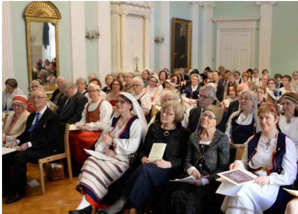
Yhdistyksen 60-vuotisjuhla 2017 Empiresalissa

”Perinne ja kulttuuri kuuluvat elämään, antavat iloa ja voimaa arkeen sekä juhlistavat juhlan. Yhdessä etsimme uusia näkökulmia perinteeseen.”