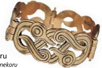
Kalevala Koru Iku-Turso -rannekoru

Suomen Perinnetekstiilit Oy jatkaa Helmi Vuorelman toimintaa. Tehtaanmyymälän osoite on Kisällinkatu 5, 15170 Lahti. Kansallispukutuotteita voi etsiä verkko-osoitteesta: vuorelma.net .