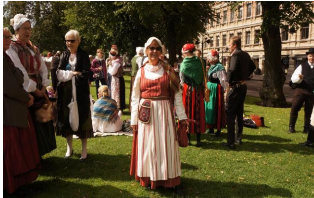
Kansallispuukujen tuuletusta Espan puistossa kesällä 2019

Lisää tietoa tapahtumista saa yhdistyksen kotisivuilta ja jäsenkirjeistä.