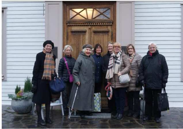
Vierailu Mannerheim-museoon syksyllä 2019

Kokoonnumme maanantaisin klo 18 noin kerran kuussa Bulevardin seurakuntasalissa osoitteessa Bulevardi 16 B, 2. kerros. Tilaisuudet ovat avoimia myös ystäville.